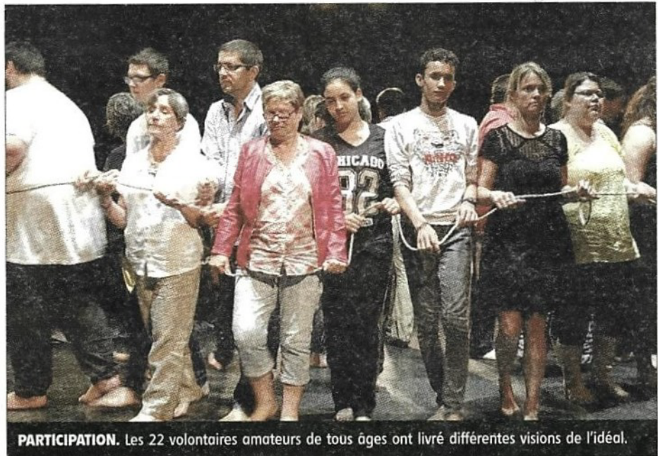
PARTICIPATION. Les 22 volontaires amateurs de tous âges ont livré différentes visions de l'idéal.

Le spectacle, conçu et mis en scène par Saturnin Barré et Virginie Soum, de la Tribu d'essence, constitue la finalisation d'un travail de récolte initié en 2014, par le biais d'ateliers d'écriture dans plusieurs établissements scolaires.