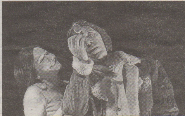
Hélas pour Tytyl, cette belle mésange n'est pas le mystérieux oiseau bleu.

Les élèves des classes des cours élémentaires et cours moyens ainsi que les sixième et cinquième des collèges du Pays châillonnais ont pu découvrir la pièce L'oiseau bleu , de Maurice Maeterlinck au théâtre. La pièce a été adaptée et mise en scène par Saturnin Barré, présent lors des représentations.