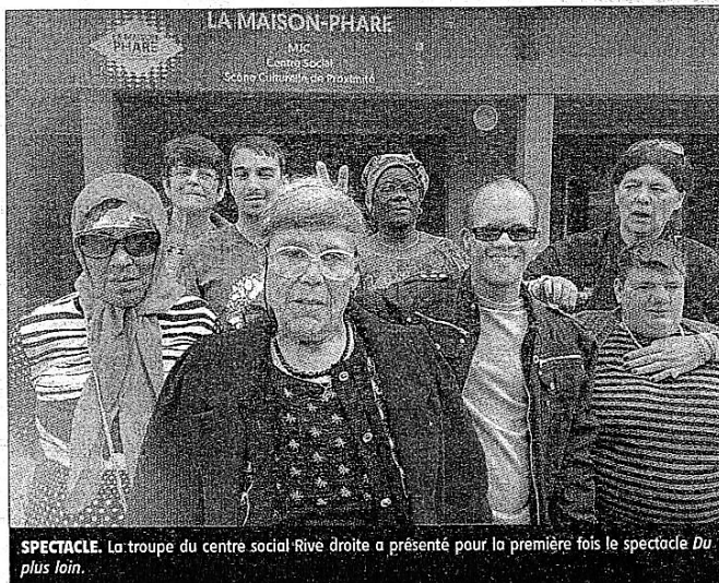
SPECTACLE. La troupe du centre social Rive droite a présenté pour la première fois le spectacle Du plus loin .