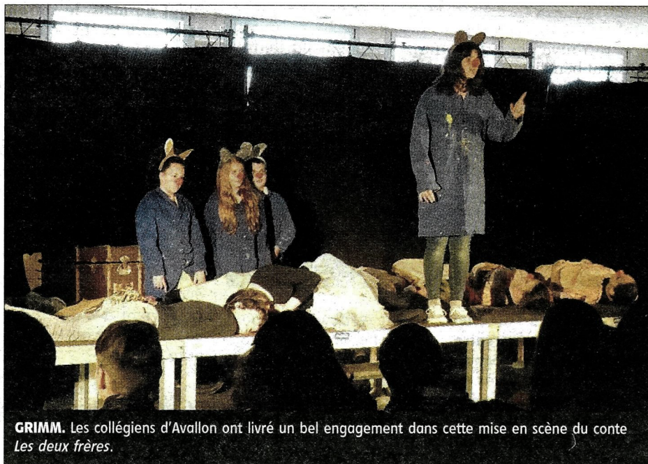
GRIMM. Les collégiens d'Avallon ont livré un bel engagement dans cette mise en scène du conte Les deux frères .

L'après-midi s'est poursuivi avec la mise en scène