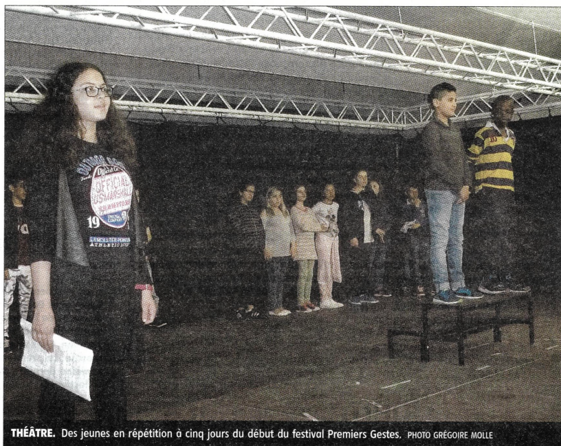
THÉÂTRE. Des jeunes en répétition à cinq jours du début du festival Premiers Gestes.

Le festival Premiers gestes est né de l'envie de montrer une partie du travail réalisé, tout au long de l'année, par la troupe Tribu d'Essence. En résidence depuis 2014 à la maison de quartier Rive Droite, à Auxerre, elle accompagne, dans les quartiers, les groupes amateurs vou-