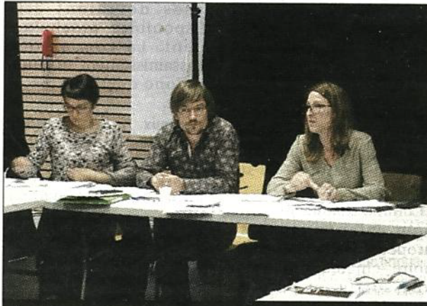
ÉCHANGES. Les acteurs locaux de la culture se sont retrouvés, mercredi.

Connaître les réalités et les problématiques de chaque structure, réfléchir ensemble aux moyens de faire venir le public dans les différents lieux culturels de la ville... Les discussions ont été riches entre les 25 professionnels de la culture. « Nous avons bâti des orientations dans nos services pour la capta-