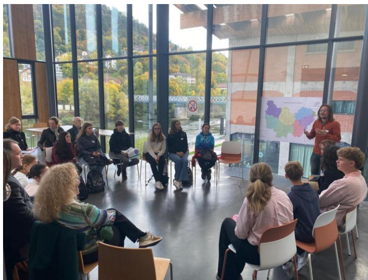
Échanges Jeunes/élus lors de Coup de projecteur 2025